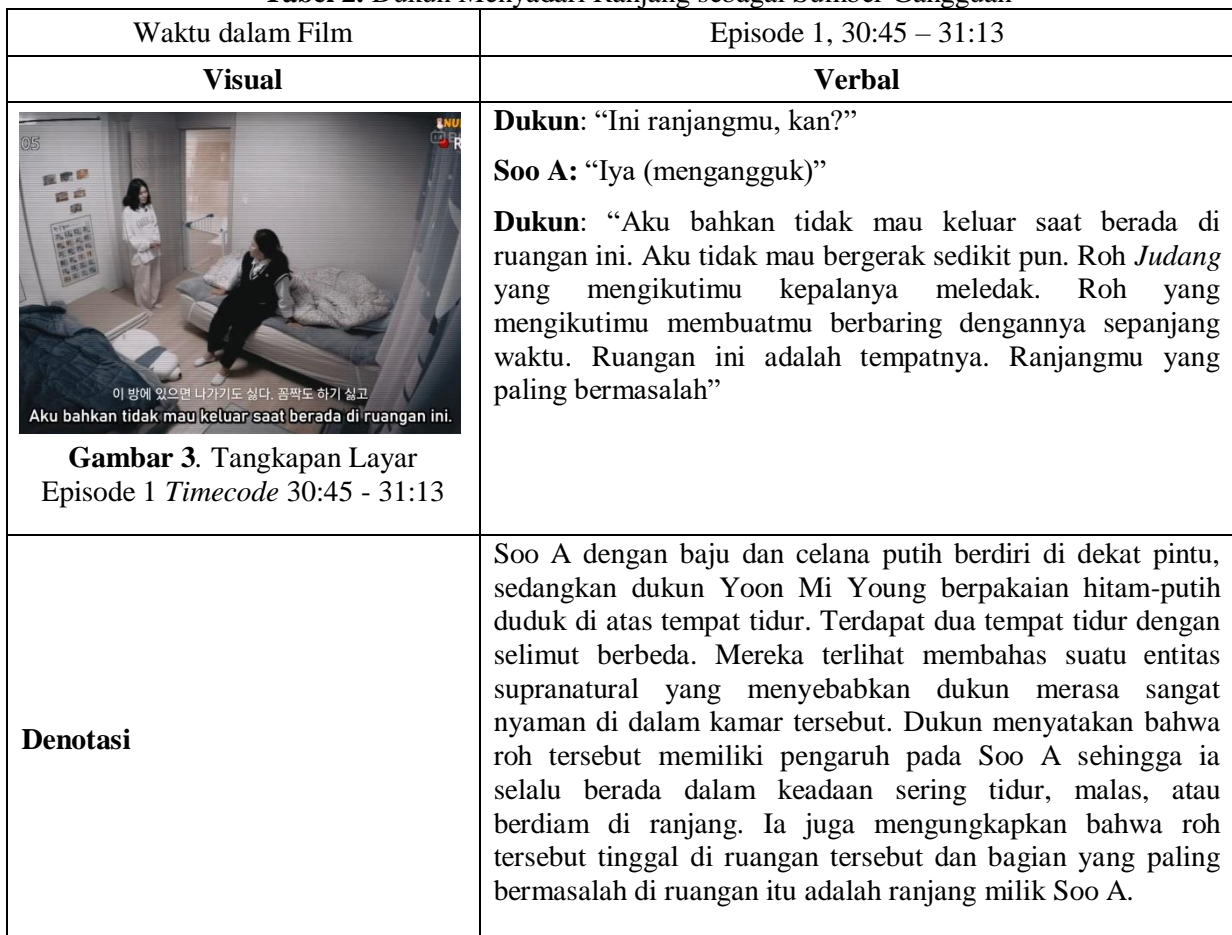
Tabel 2. Dukun Menyadari Ranjang sebagai Sumber Gangguan

Anggapan ini lahir dari tradisi shamanisme yang menempatkan dukun sebagai figur yang mendapatkan wawasan dari hasil intuitif, komunikasi dengan dewa atau roh, serta kepekaan terhadap getaran energi yang diyakini menyimpan informasi tersembunyi tentang kehidupan individu (Schlottmann, 2020).