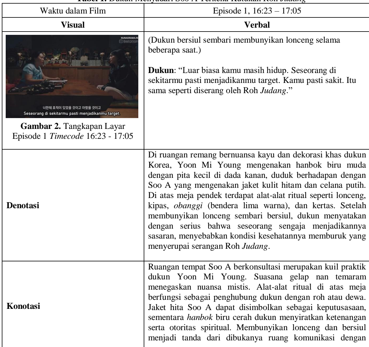
Tabel 1. Dukun Menyadari Soo A Terkena Kutukan Roh Judang

Peneliti memilih adegan serta dialog dalam film dokumenter Shaman: Whisper from the Dead yang dianggap dapat merepresentasikan dukun pada sub cerita “Kutukan Roh, Serangan dari Hantu” terkhusus sebagai medium sekaligus jembatan komunikasi antara manusia dan para roh atau dewa. Adegan tersebut lalu dibedah dengan analisis semiotika Roland Barthes dan ditemukan beberapa representasi dukun sebagai medium komunikasi yang dibagi dalam beberapa kategori, di antaranya: Dukun sebagai Pendeteksi Gangguan Spiritual .