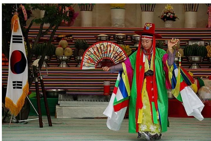
Gambar 1. Dukun Memimpin Ritual Gut

Gut merupakan ritus utama dalam shamanisme Korea yang menyatukan unsur musik, tari, narasi, dan persembahan untuk membangun komunikasi dengan roh (Lee & Kim, 2017). Jenisnya bervariasi berdasarkan tujuannya, mulai dari penyembuhan, keberuntungan, hingga upacara arwah dengan dukun sebagai medium spiritual yang menyampaikan kehendak roh (Zahira, 2019).